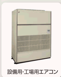
設備用・工場用エアコン