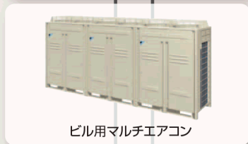
ビル用マルチエアコン