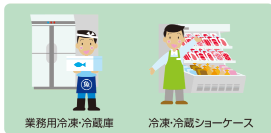
業務用冷凍・冷蔵庫

コンデensingユニット、冷凍・冷蔵ショーケース、冷凍・冷蔵庫、冷凍・冷蔵装置、ヒートポンプ給湯機など