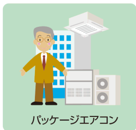
パッケージエアコン

パッケージエアコン、ターボ冷凍機、チラー、スクリーン冷凍機、スポットエアコン、ガスヒートポンプエアコン、除湿器など